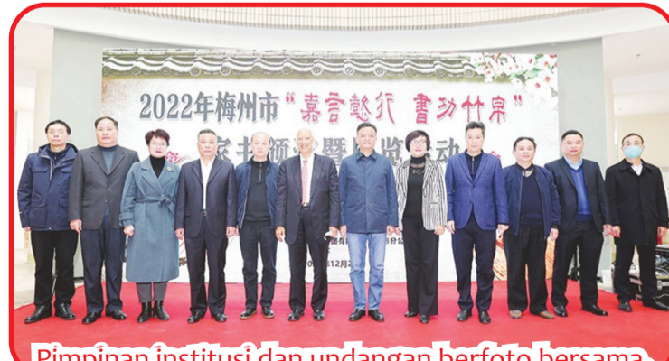
Pimpinan institusi dan undangan berfoto bersama.