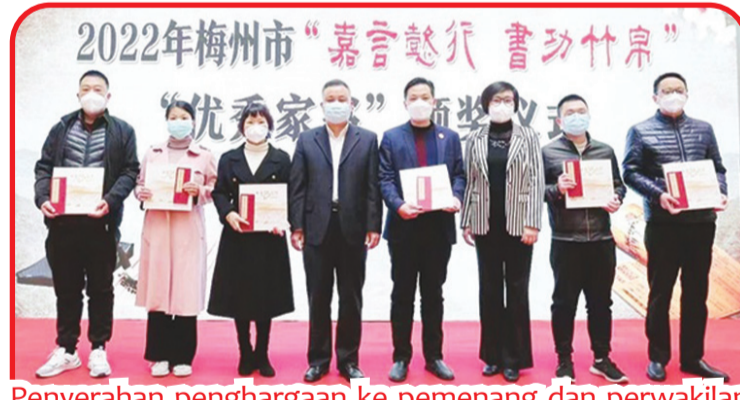
Penyerahan penghargaan ke pemenang dan perwakilan "Excellent Family Letters".