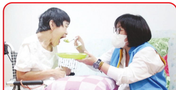
Seorang relawan MTPB sedang menyuapi seorang lansia.