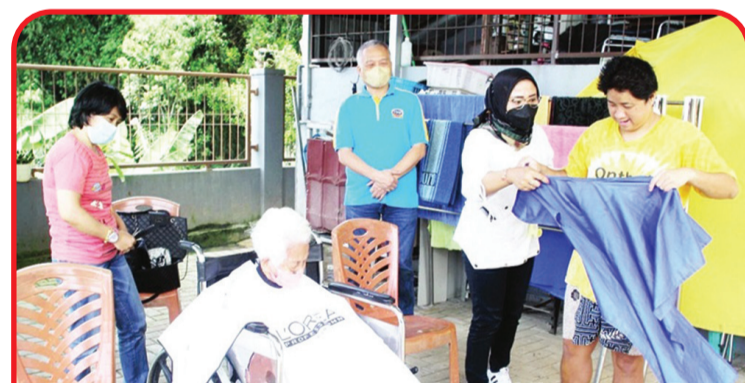
Relawan MTPB memotong rambut salah seorang lansia.