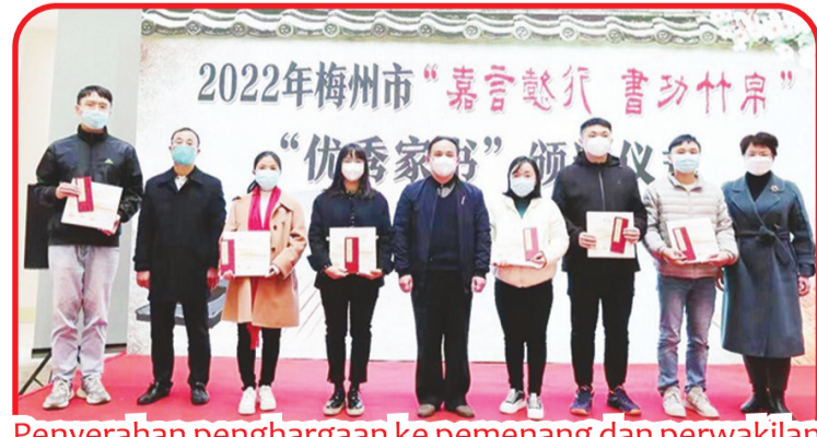
Penyerahan penghargaan ke pemenang dan perwakilan dari "Excellent Family Letters".