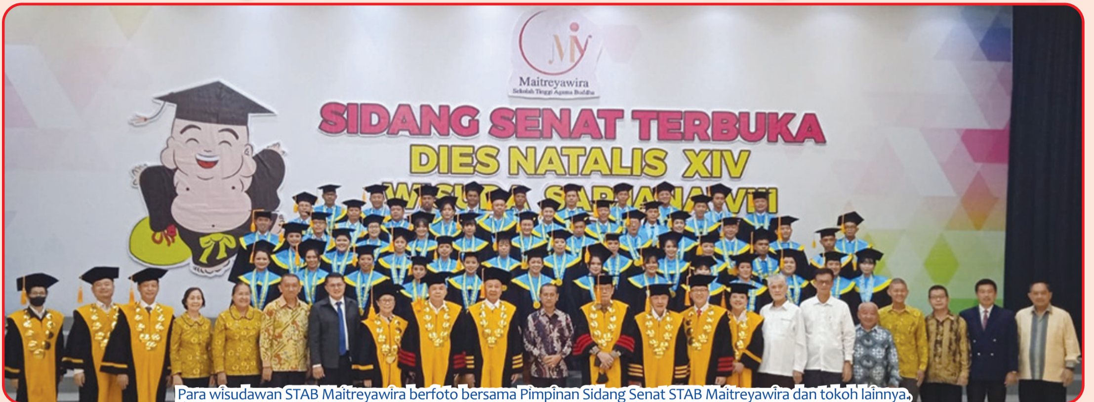
Para wisudawan STAB Maitreyawira berfoto bersama Pimpinan Sidang Senat STAB Maitreyawira dan tokoh lainnya.

RIAU (IM) - STAB (Sekolah Tinggi Agama Buddha) Maitreyawira Riau, Sabtu (17/12) lalu menggelar Sidang Senat Terbuka Dies Natalis XIV dan Wisuda Sarjana VIII. Wisuda berlangsung di Fortunate Convention Hall Puskidlat Bumi Suci Maitreya Jalan Riau Ujung, Kecamatan Payung Sekaki, Kota Pekanbaru.