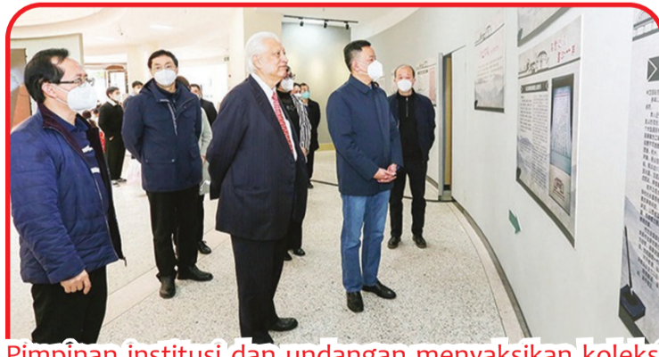
Pimpinan institusi dan undangan menyaksikan koleksi yang ditampilkan.