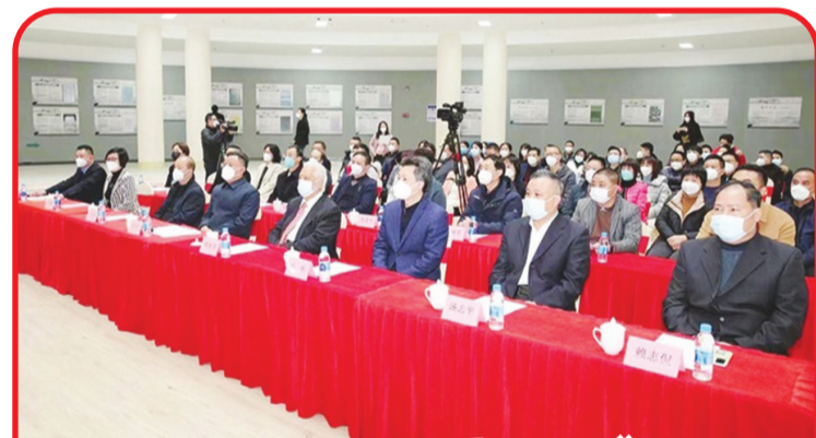
Penyerahan dan pameran Family Letters "Jiayan Yixing Shugong Zubo" Meizhou 2022.