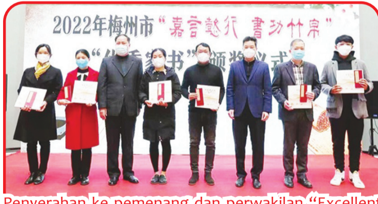
Penyerahan ke pemenang dan perwakilan "Excellent Family Letters".