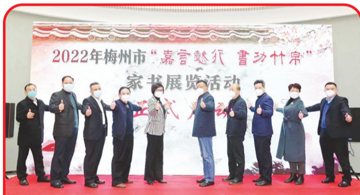
Para tokoh bersama-sama membuka pameran Family Letters "Jiayan Yixing Shugong Zubo" Meizhou 2022.