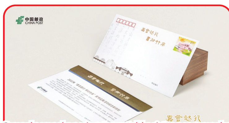
Sampul perangko peringatan untuk kegiatan pengumpulan Family Letters "Jiayan Yixing Shugong Zubo".